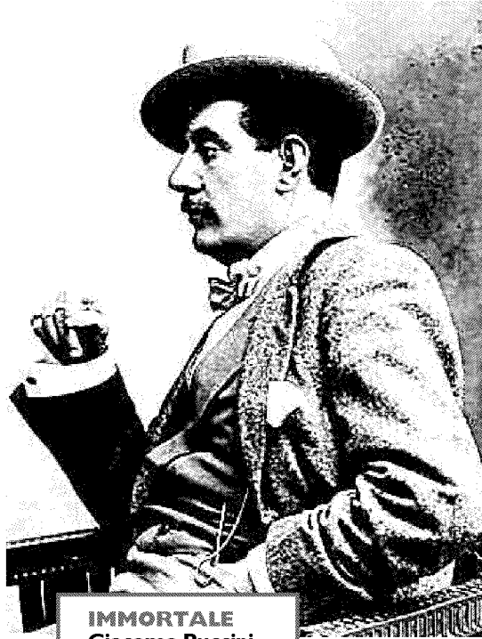
IMMORTALE Giacomo Puccini con l'immaneabile cappello