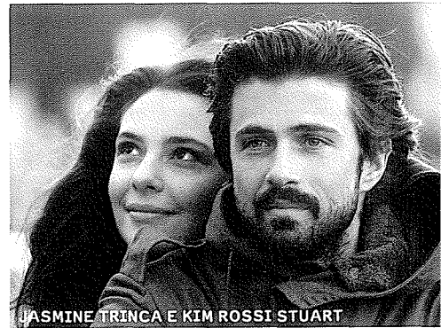
JASMINE TRINCA E KIM ROSSI STUART